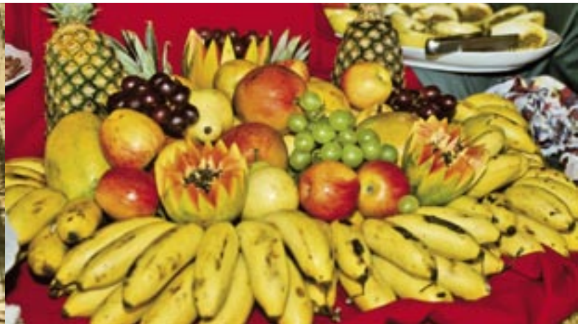
Vitaminbomben mit unvergleichlichem Aroma: frische sonnengereifte Tropenfrüchte