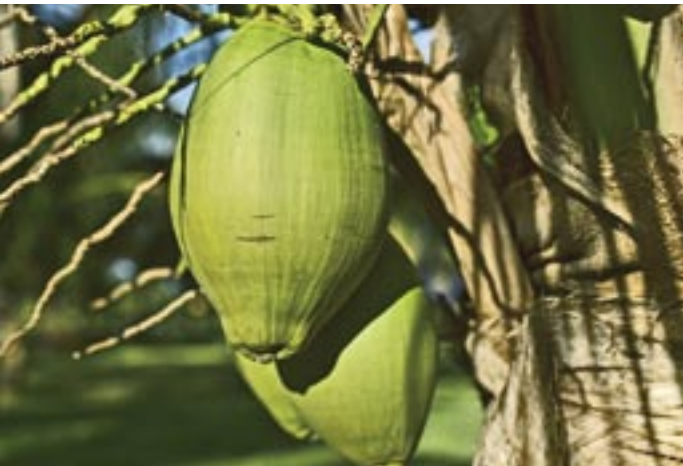
Fruchtfleisch und -wasser der Kokosnüsse sind vielseitig in der Küche verwendbar

Die Seeaalsuppe verewigte Nobelpreisträger Pablo Neruda sogar in einem Gedicht: „...auf dass du in diesem Gericht den Himmel wieder erkennst!“ Wenn das keine Empfehlung ist! Als Nachtisch kann man ja immer noch Apfelstrudel nehmen – ein Mitbringsel der eingewanderten Österreicher. Oder fragen Sie einfach auf Deutsch nach „Kuchen“ – denn so heißt er auch bei den Chilenen. ■ G.F.